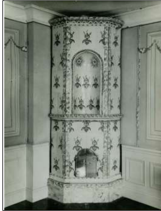
Blåvit kakelugn, försedd med nisch