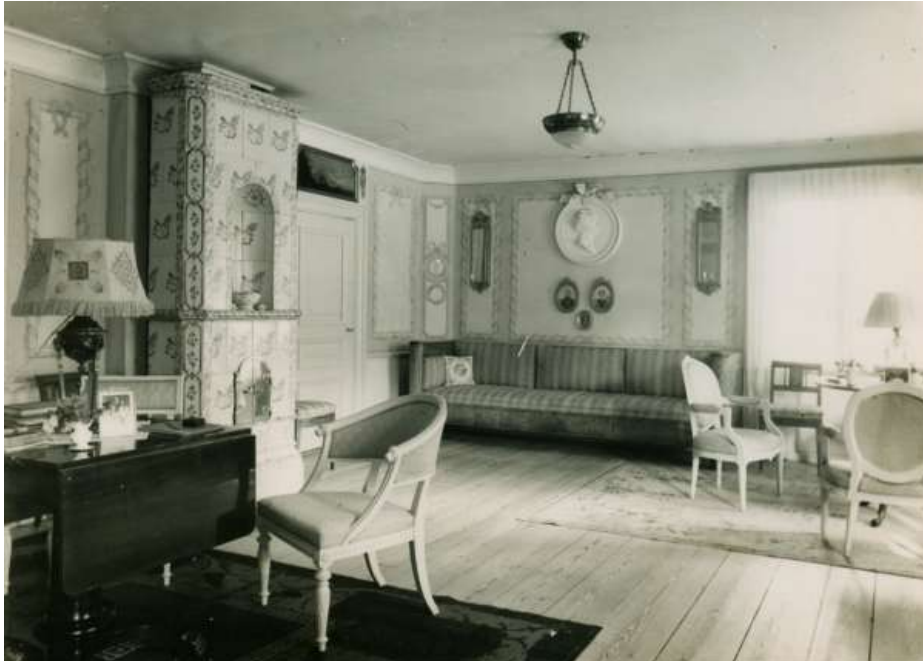
Salongen, försedd med målade dörröverstycken

Dörröverstycken utgörs av romantiska landskap med sjöar och ruiner målade i olja på väv. I bottenvåningen finns några 1700-talskakelugnar med ornament i blått eller violett. Kakelugnarna ha nischer och äro välbevarade, ehuru omsatta flera gånger. Ombyggnaden på 1850-talet var synnerligen genomgripande. Vid denna tillbyggnad revos de andra boningshusen vid mangården och virke därifrån har använts till övre våningen. På vinden finnas stockar, vilka bära rester av 1700-talstapeter med ett rutmönster av blått och vitt mot gråvit botten. Endast rättarebostaden överlevde rivningsivern och moderniserades, då bland annat den gamla spisen med sin bakugn ersattes med en modern kokspis.