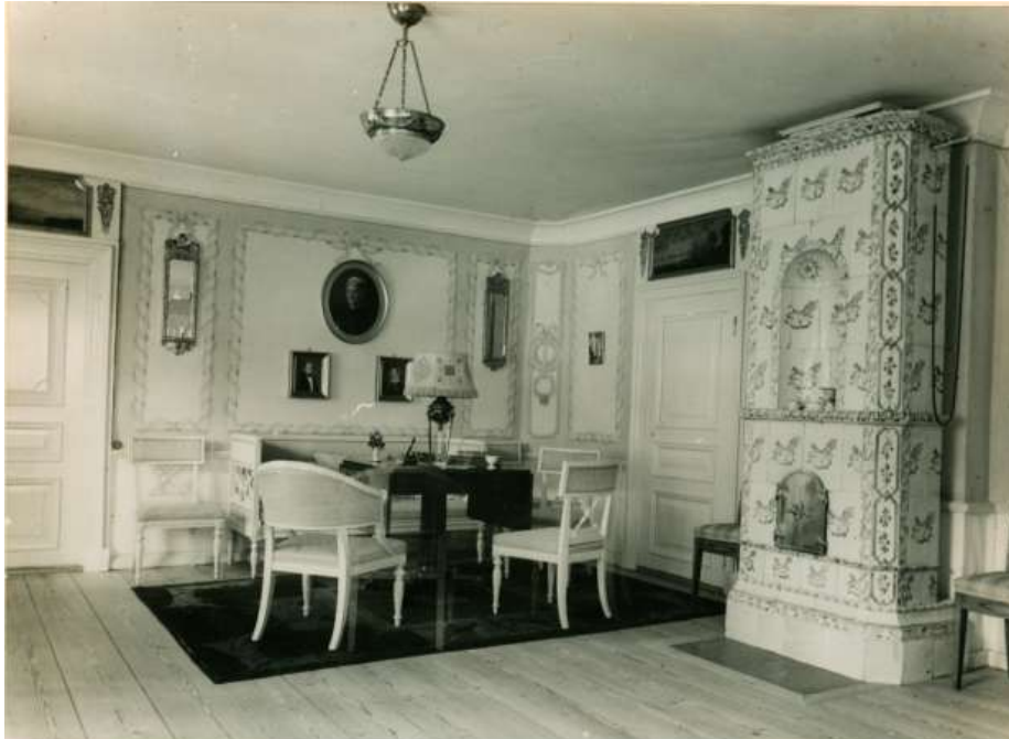
Salongen ur annan vinkel