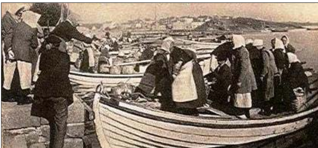
Madammerna från Hästö anländer till staden med korgar fulla av sill försäljning

Egendomen har vinter och sommar fött 20 st. kor, 1 st. tjur, 12 st. ungdjur, 4 par oxar, 6 st. hästar, 40 st. får, 8 á 10 st. svin samt en stor mängd fjäderfän såsom cirka 500 st. höns, förutom kalkoner, gäss, ankor m.m. som med godsskötsel lämnat ganska riklig avkastning och blivit lätt avyttrat såväl i Karlskrona som i Stockholm. Från det ypperliga fiskevattnet hämtas årligen, bland annat, flera tusen valar sill, som vanligen betingar 25 á 33 öre per val. God jakt kan också idkas å lägenheten.