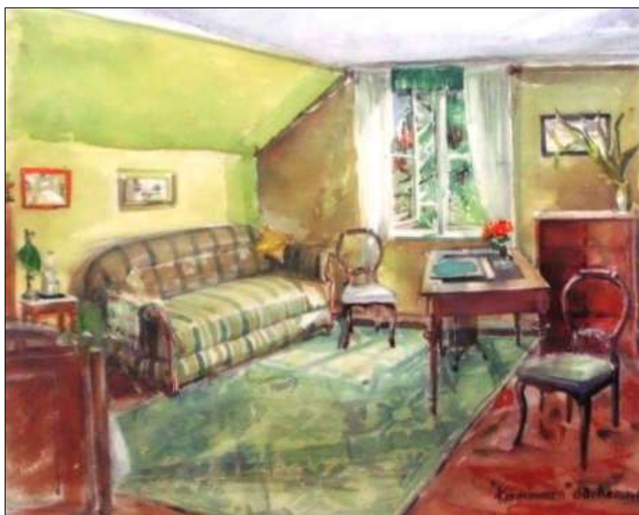
Petersonska kammaren, belägen på 2:a våningen

1=lilla stugan, första huset, 3=huset var Petersons hem, 5=verkstad, 8-10= svinhus, stall