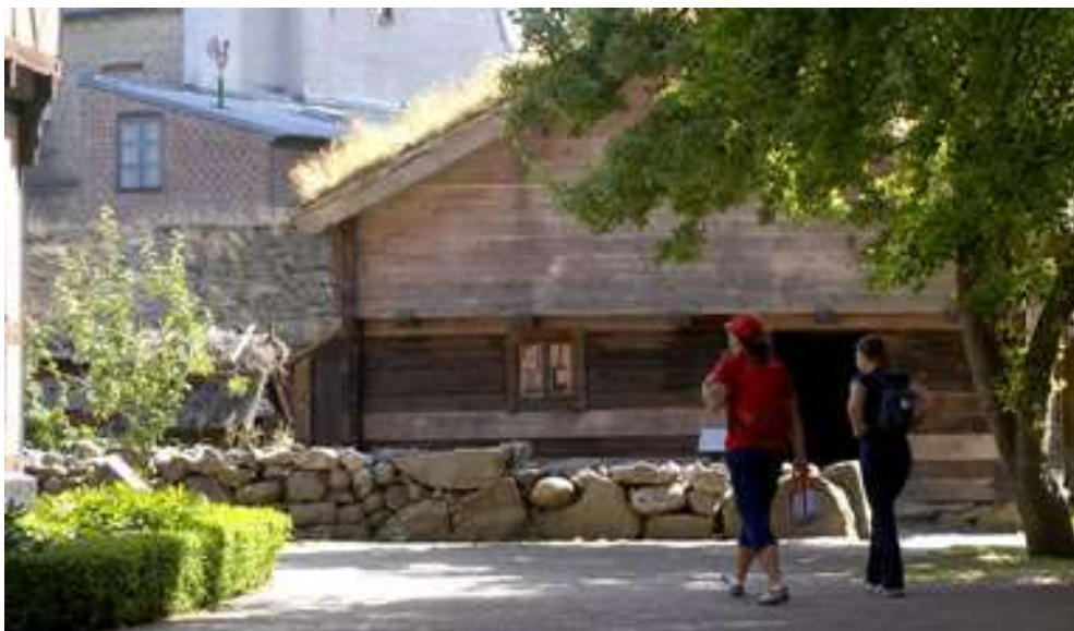
Kulturen i Lund