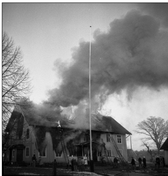
Vedeby herrgård brann ner till grunden 1953